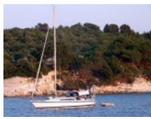
Lagon, arrière plan Kalem Ad