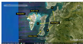
bademli.jpg JPEG - 66.1 ko 800 x 409 pixels