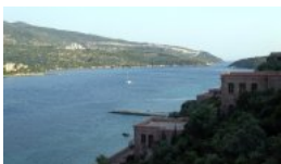
Vers la côte depuis Kalem Ad