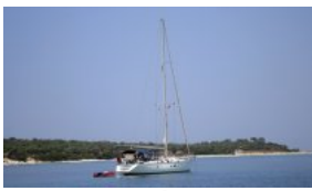
le lagon, en arrière plan Garip Ad