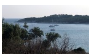
Lagon entre Garip et Kalem Ad