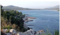
Hôtel de vacances sur Kalem Ad