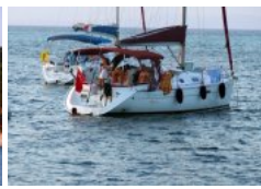
Lagon et « new way of live » turc