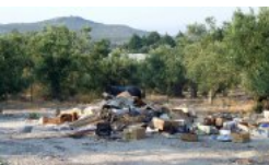
Hôtel de vacance l'autre face