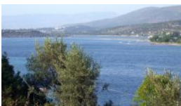
Vue vers Bademli depuis Kalem Ad