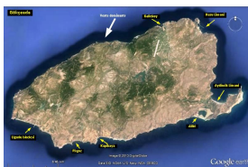
ba_gokceada_ge.jpg JPEG - 67.1 ko 800 x 517 pixels