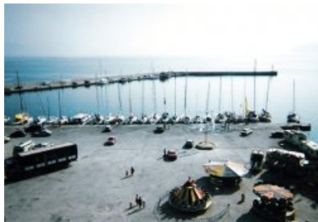
Arrière au quai du débarcadère