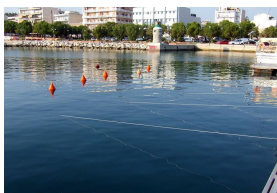
Bouée sur corps morts, au début du môle JPEG - 86.4 ko 800 x 549 pixels