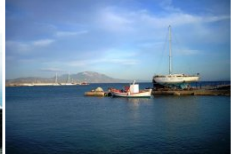
Depuis la marina, en arrière plan, le môle