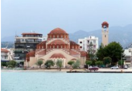
Amer, immanquable, à côté de l'embarcadère.